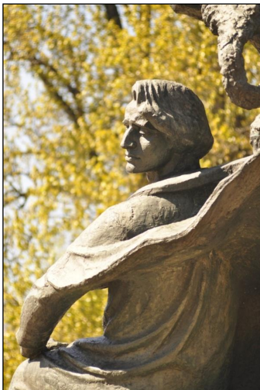
Pozostanę z Wami