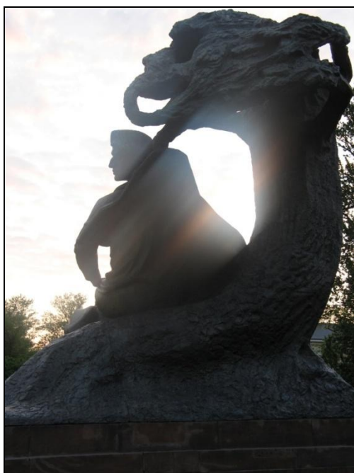
Pomnik Fryderyka Chopina