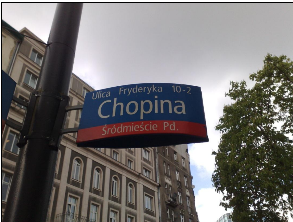
Ulica Fryderyka Chopina w Warszawie