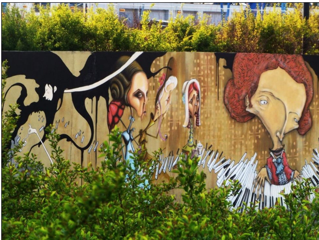
Graffiti u wylotu tunelu od ul. Złotej